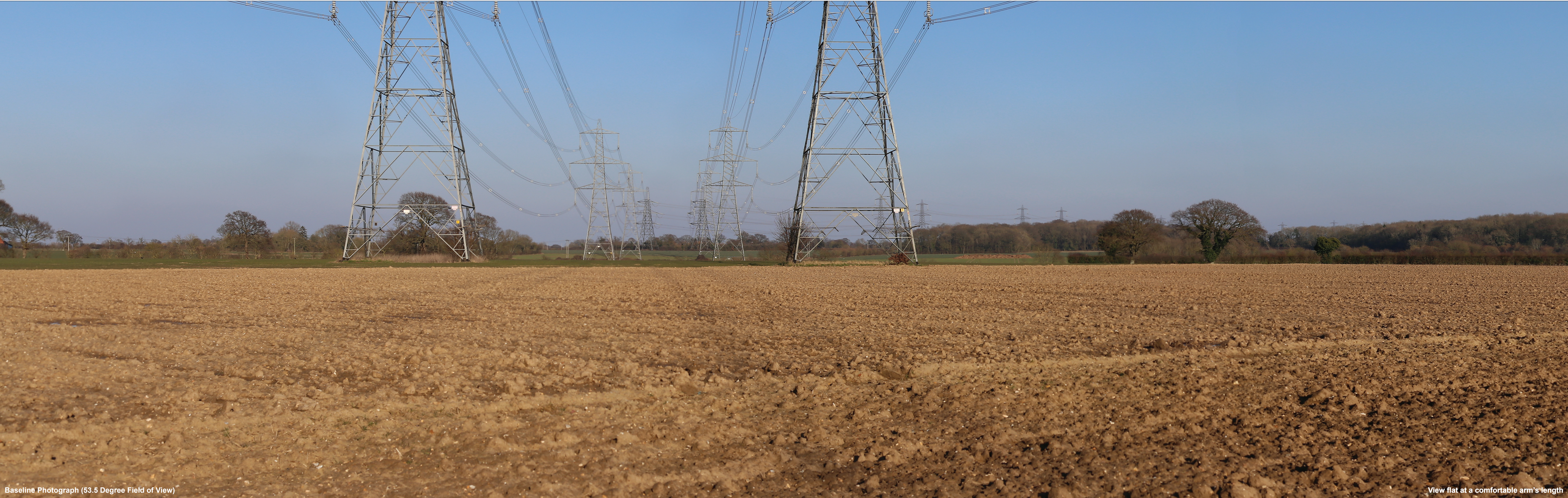
Baseline Photograph (53.5 Degree Field of View)