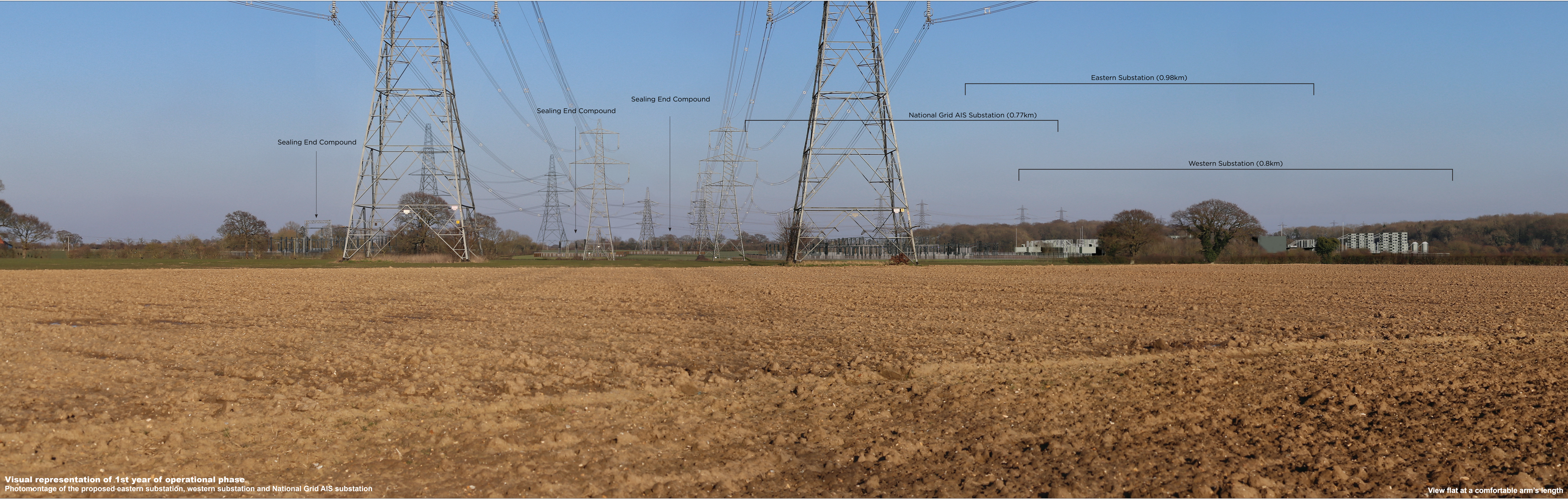
Visual representation of 1st year of operational phase Photomontage of the proposed eastern substation, western substation and National Grid AIS substation